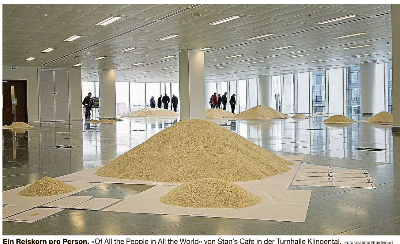
Ein Reiskorn pro Person. «Of All the People in All the World» von Stan's Cafe in der Turnhalle Klingental.