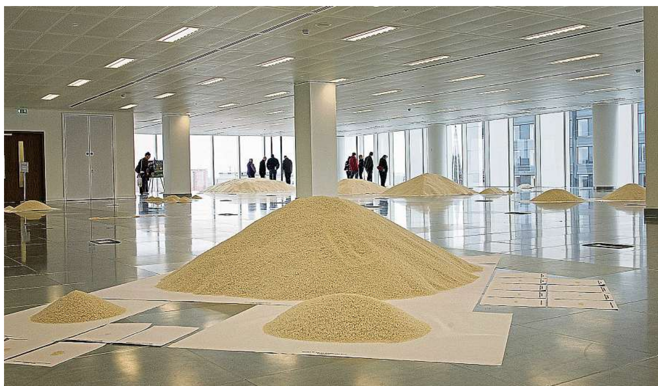
Ein Reiskorn pro Person. «Of All the People in All the World» von Stan's Cafe in der Turnhalle Klingental.